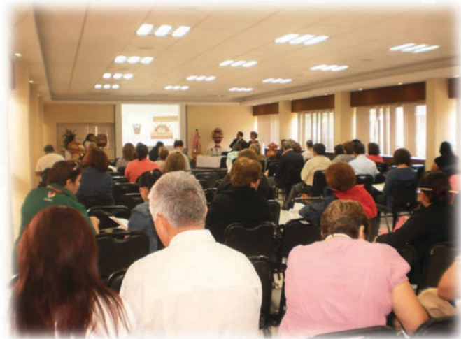
Sesión en el Auditorio José Raúl Silva Zaragoza